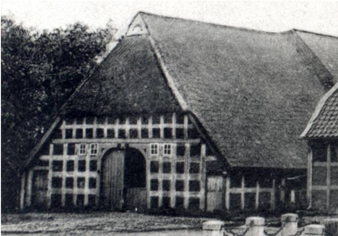
Das Bild zeigt den Hof Oyten 11 vermutlich um 1920/25.

Datum Personen / Ereignisse geboren/getauft verstorben/beerdigt