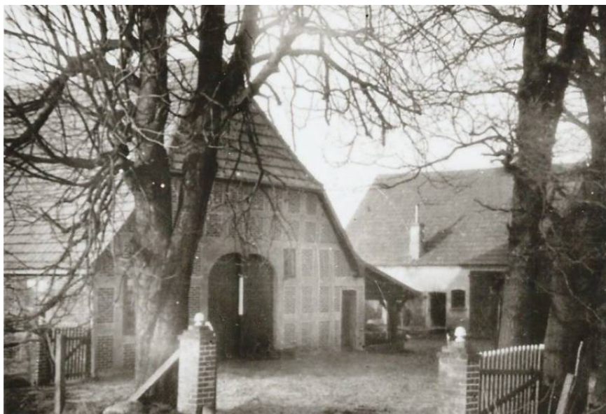
Der Hof Od-009 um 1930.