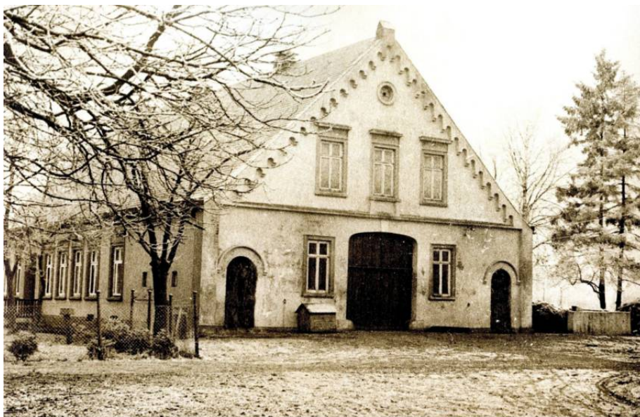
Hof Oyterdamm 4 - erbaut 1877