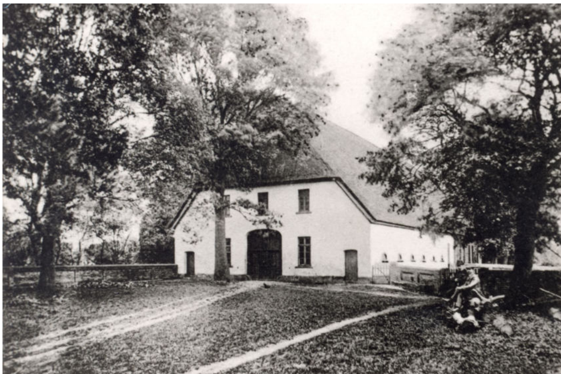
Zum Anwesen gehörten noch die vier Nebenhäuser 15a-d. Die Scheune 5a und der Schweinestall 15c standen neben dem Haupthaus. Der Schafstall 15b stand in der Lindenstraße 52 (heute Haus Oyten 174). Das Häuslingshaus 15d stand an der Hauptstraße. Auf dem Foto zu Haus Oy 116 + 117 ist Haus 15d im Hintergrund erkennbar.

Datum Personen / Ereignisse geboren/getauft verstorben/beerdigt