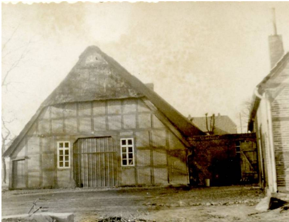
Hof Dieling, Ecke Holzdamm