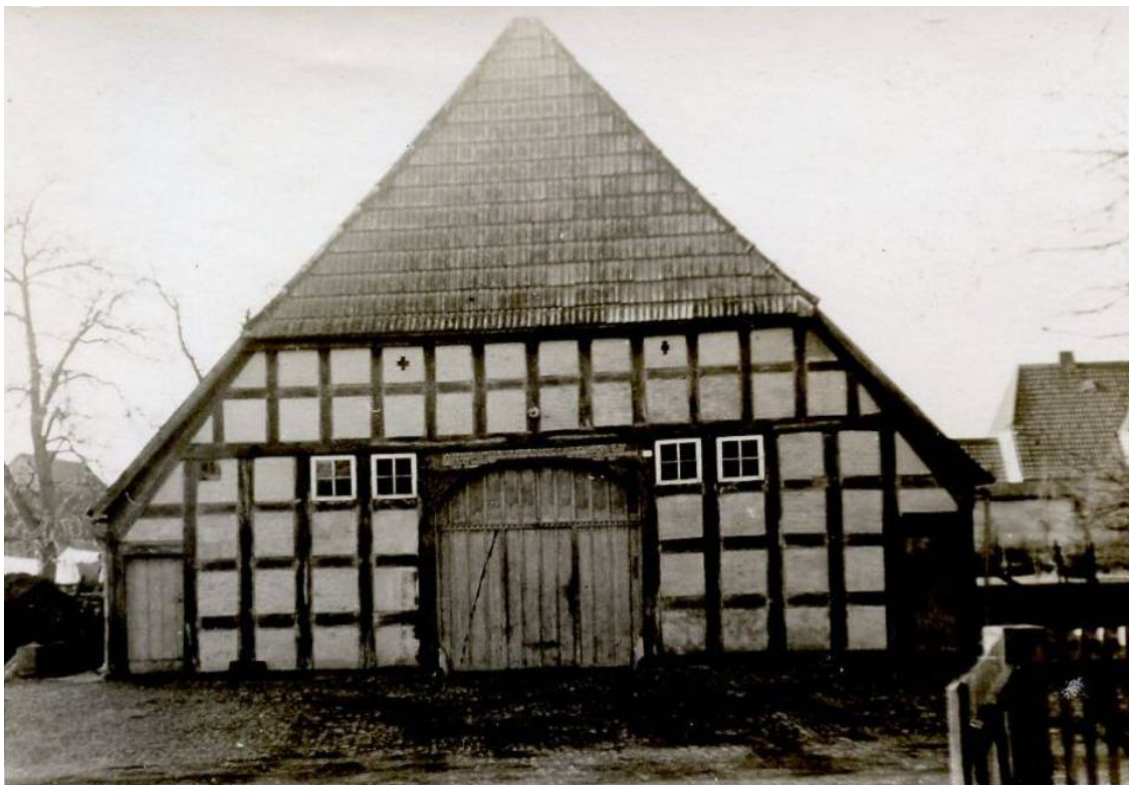
Der Hausname "Stoffers" ist vermutlich auf Christoph Osmer zurückzuführen.

Datum Personen / Ereignisse geboren/getauft verstorben/beerdigt