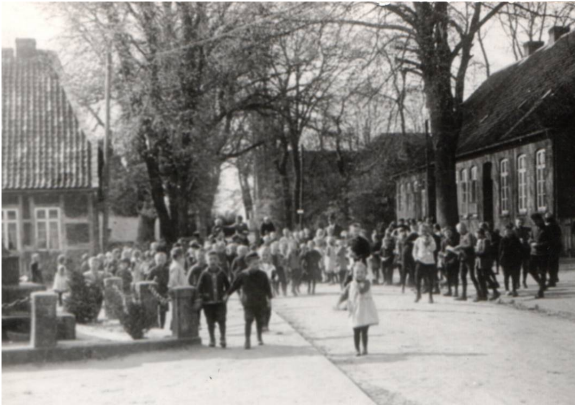
Bild 2 : Einen Schulhof gab es nicht. Die Pause war auf der Dorfstraße.