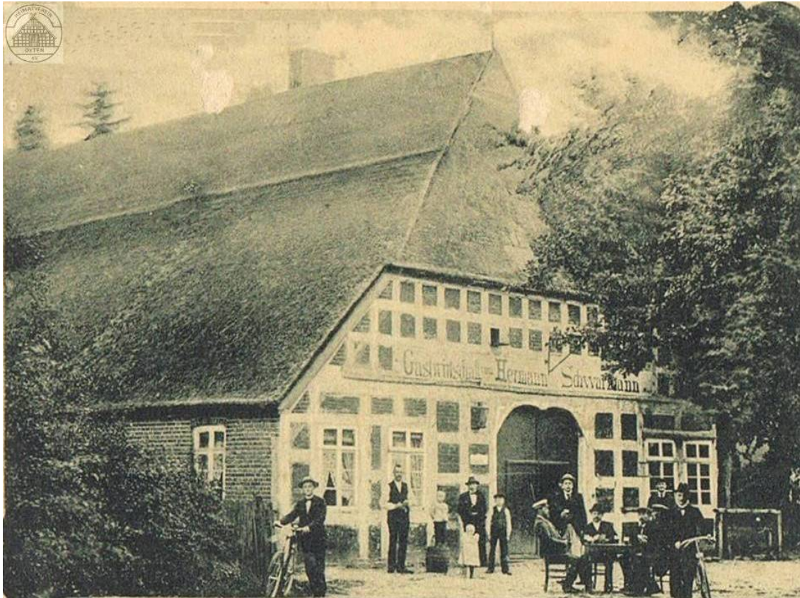
Das Bild zeigt die " Gastwirtschaft von Hermann Schwarmann " um 1897. Das Haus stand weiter hinten auf dem Grundstück und schräg zur Hauptstraße. Die Front zeigte nach Nordwest (etwa auf den Schlachter Biesewig).

Datum Personen / Ereignisse geboren/getauft verstorben/beerdigt