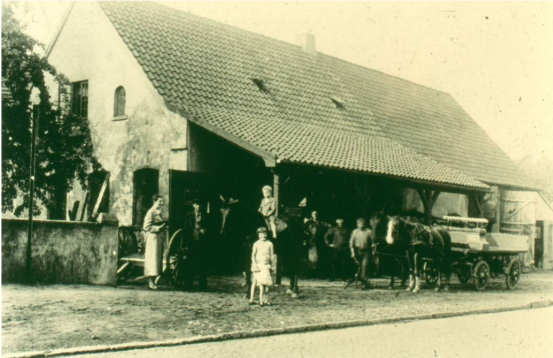
Das ist die Schmiede Hollmann, direkt an der Oytener Hauptstraße gelegen. Das Wohnhaus stand ein paar Meter weiter links, mit ca. 10 Meter Abstand und leicht schräg zur Hauptstraße.