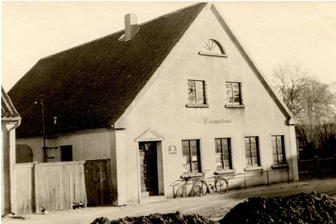
Nebenhaus 11a um 1950.

Das Nebenhaus 11 a war ursprünglich eine Scheune der Baumannstelle Oyten 11 und wurde im Jahr 1879 errichtet.