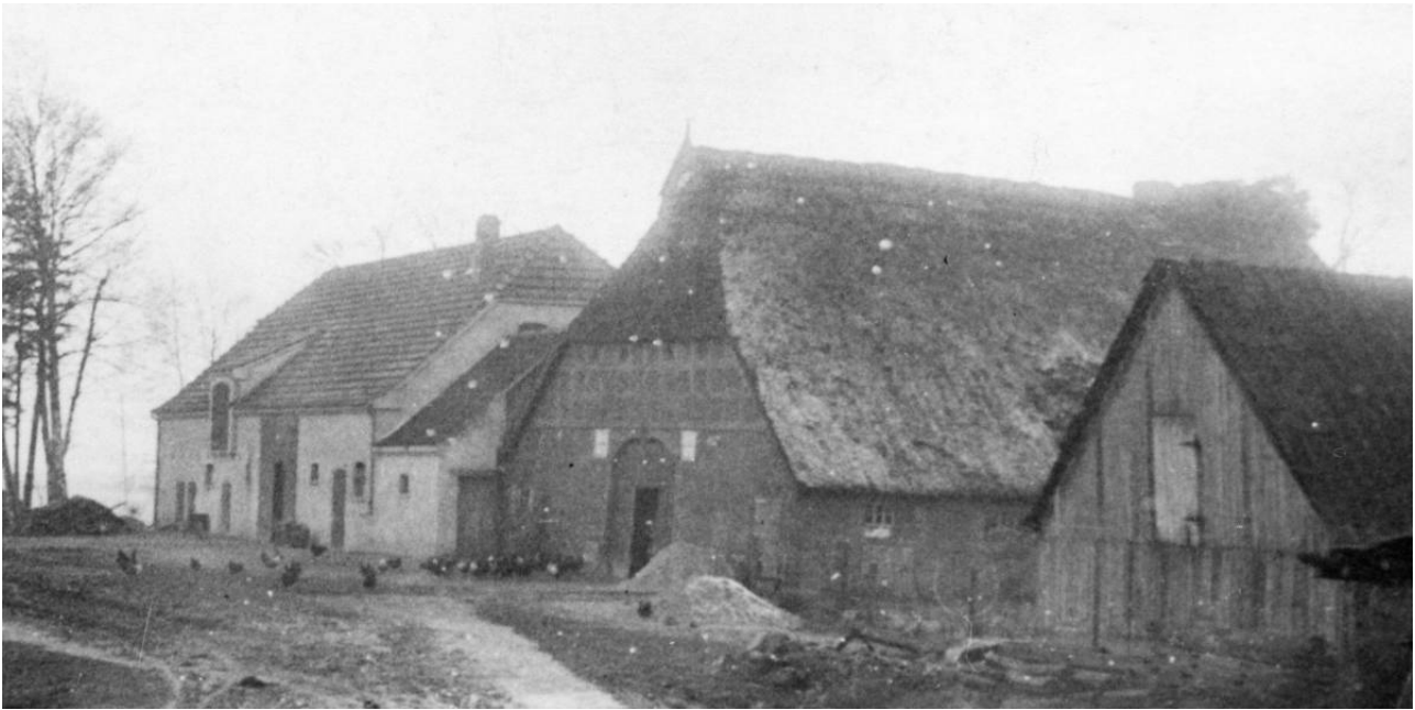
Der Hof Oyten 43 um 1920, gelegen an der Ecke von 'Am Berg' und 'Oyterdamm'. Noch bis 1865 wurde der Hof in den Kirchenbüchern als zu Oyterdamm gehörig aufgeführt.