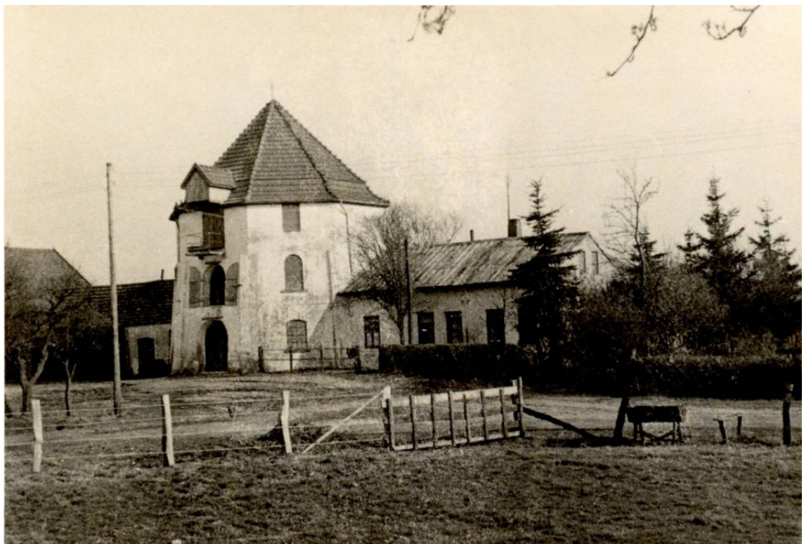
Bild 3: Ansicht der Oyter Mühle um 1950 - sie ist schon lange keine Windmühle mehr.