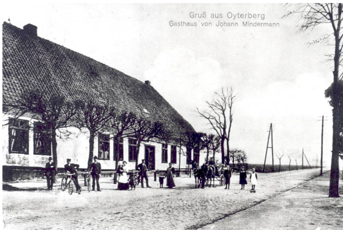
"Zöllner", erbaut um 1813