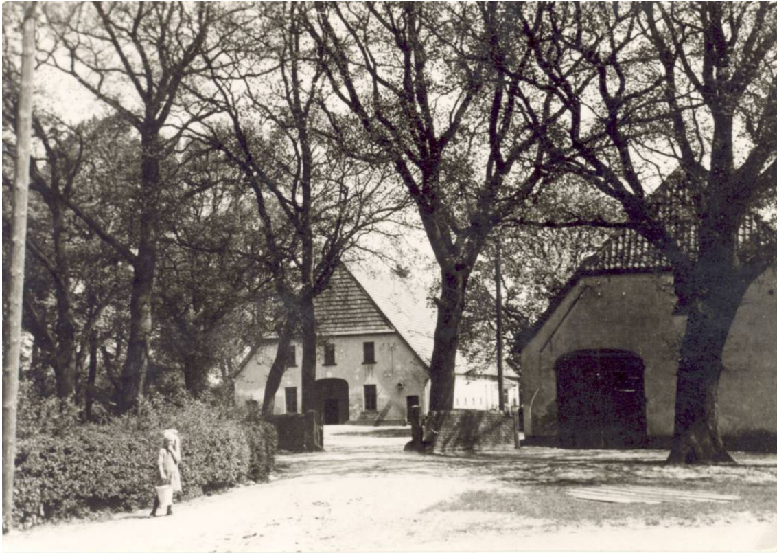
Der Blohme-Hof um 1950

Datum Personen / Ereignisse geboren/getauft verstorben/beerdigt