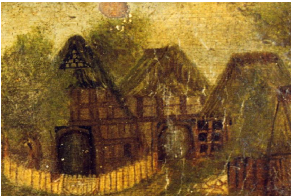
Diese Ansicht ist ein Ausschnitt aus einem Bild, das vmtl. um 1720 entstanden ist. Es zeigt in der Bildmitte das Haus Oyten 10 - im Hintergrund gelegen.

Datum Personen / Ereignisse geboren/getauft verstorben/beerdigt