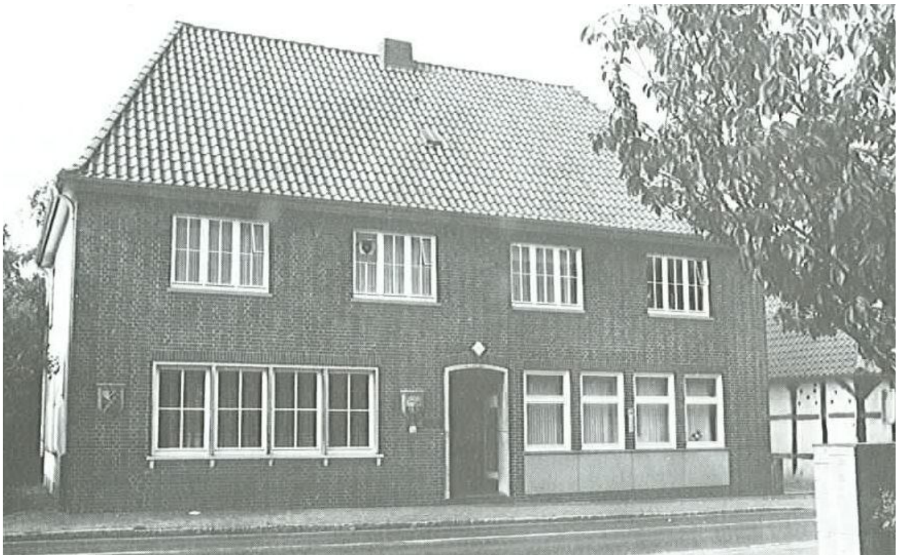
Das Haus der Kreissparkasse um 1975. Seit 1967 ist es das Oytener Rathaus. Rechts im Bild ist noch das Nebenhaus zum Hof Oyten 42 zu sehen.