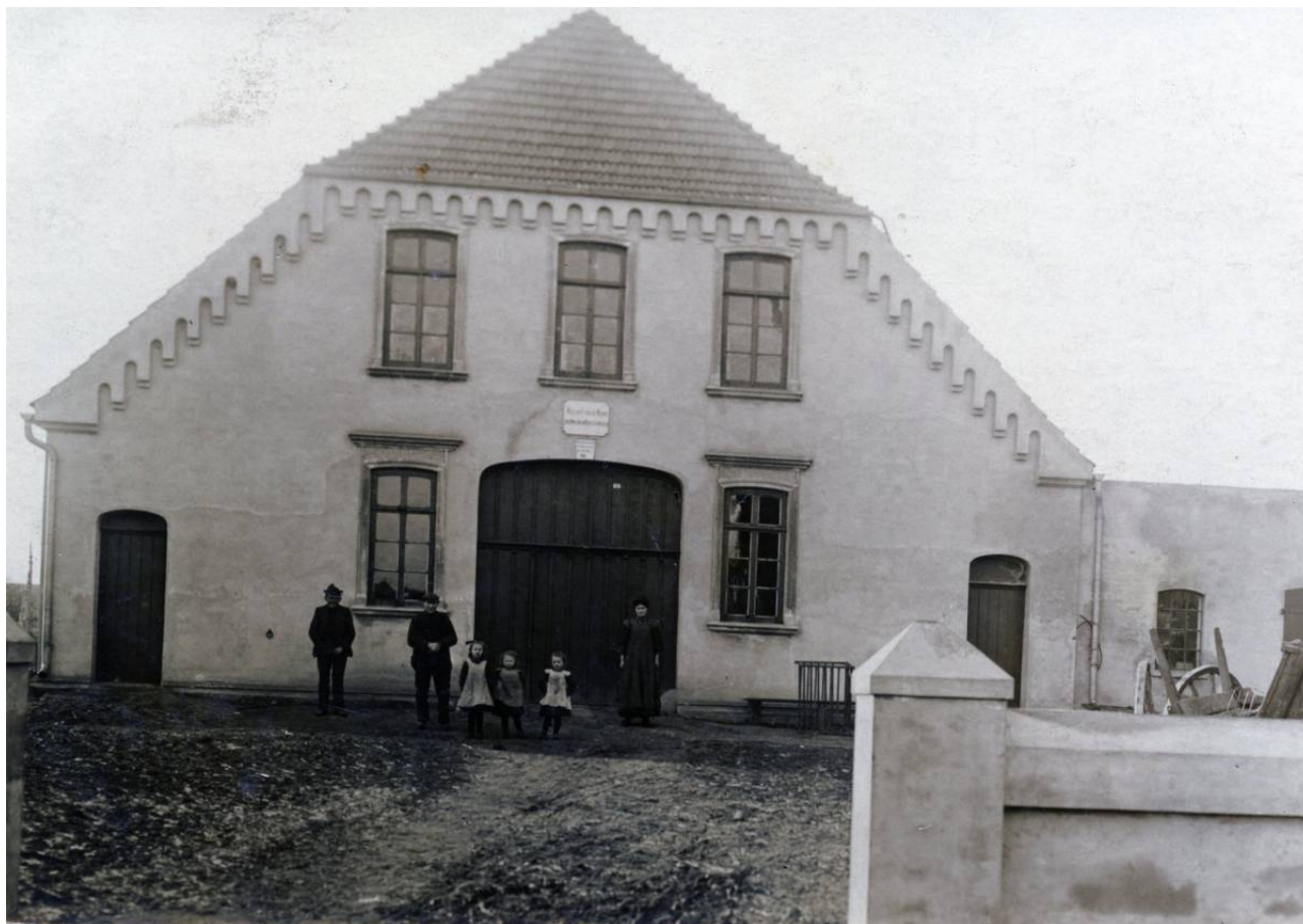
Der Hausname "Tietjen Heini" wurde vermutlich vom Namen "Titje Lürs" abgeleitet.

Datum Personen / Ereignisse geboren/getauft verstorben/beerdigt