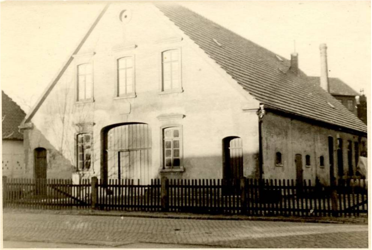
Das Haus wurde 1908 neu erbaut. Es steht auch noch im Jahr 2023 nahezu unverändert da. Der Schornstein im Hintergrund gehört zur alten Molkerei an der Lindenstraße (Oyten 144).

Aktuell: Siehe Hinweis auf Seite 5 unten!