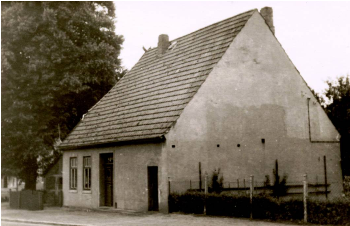
Das Haus liegt an der Hauptstraße 86 zwischen dem späteren Gemeindehaus und der Bäckerei Schmidt. Auf diesem Grundstück, zusammen mit dem Areal des um 1948/50 errichteten Gemeindehauses, steht heute das Gebäude der Volksbank Oyten, Hauptstr. 84.

Datum Personen / Ereignisse geboren/getauft verstorben/beerdigt