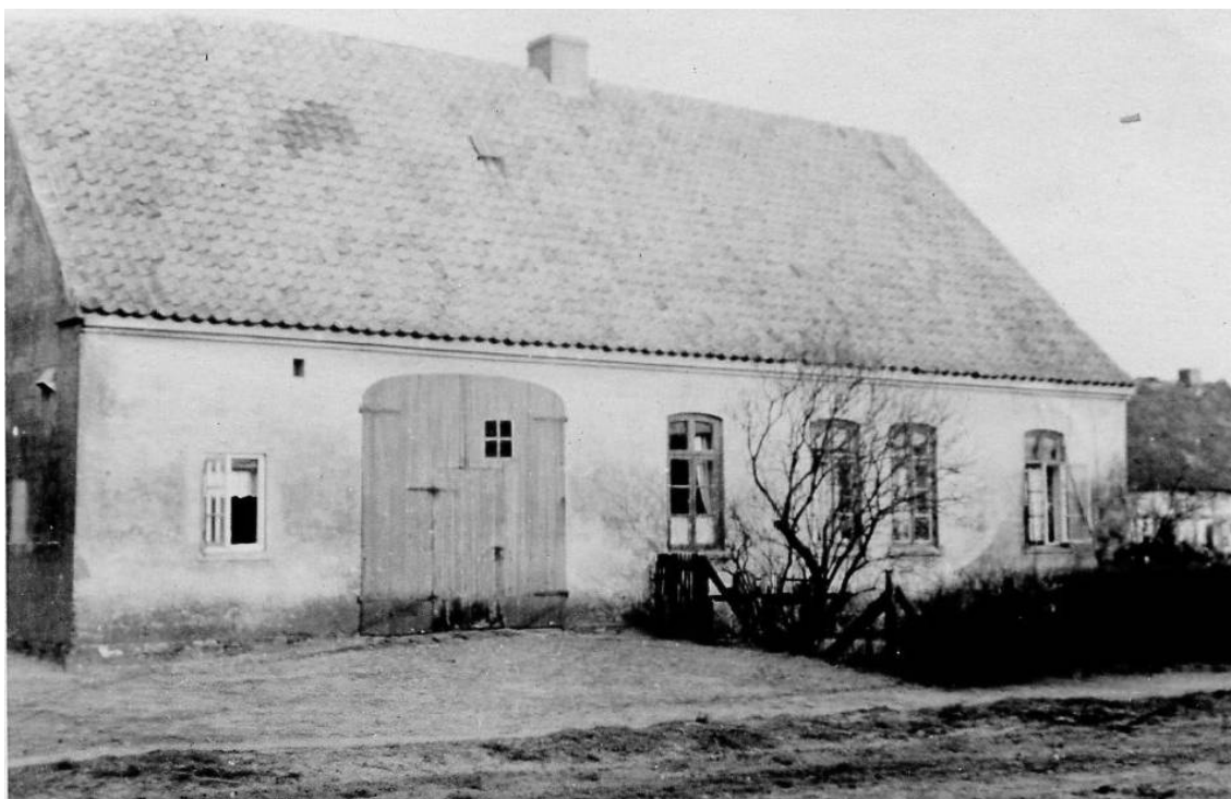
Das Bild zeigt das um 1900/01 von Heinrich Heins neu gebaute Haus Wächterstr. Nr. 5 oder Nr. 7, Ecke Lienertstr., Ansicht von der Lienertstraße. In der Karte der Landesbrandkasse (nicht datiert, vmtl. um 1880) ist an dieser Stelle das Haus Oyten 5 eingezeichnet. Zu dem Grundstück gehörten drei Häuslingshäuser mit den Nrn. 5a, 5b und 5c.