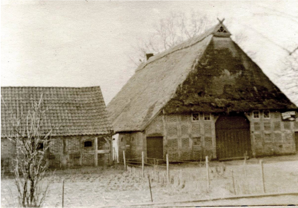
Das Bild zeigt das Haupthaus und links daneben den Schuppen 27b. Das Nebenhaus 27a stand gegenüber an der Hauptstraße, Ecke Am Triften. Für die heutige Anschrift Hauptstr. 52-58 wurde die Nummer Oyten 79-2 vergeben.