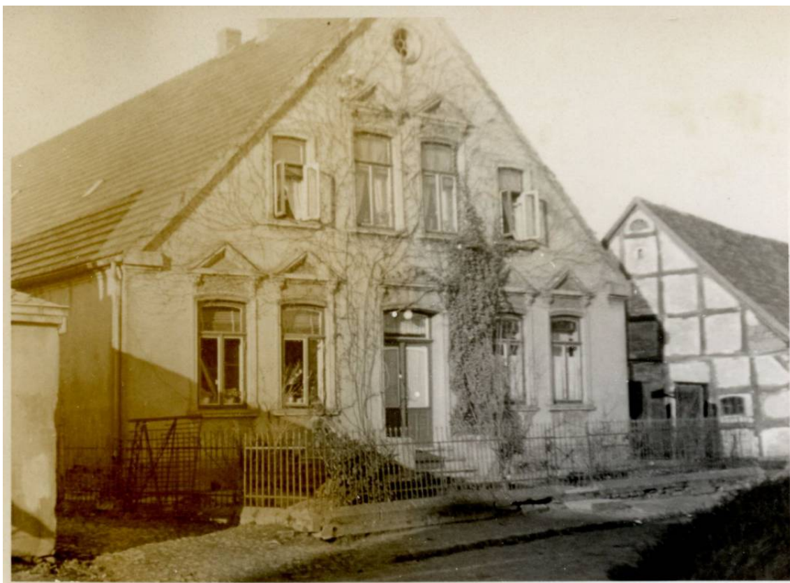
Das im Jahr 1907 erbaute Haus stand mit der Front zur Lindenstraße; rechts die Scheune, die 1951 von Bruno Stock zu einem Rundfunk- und Elektrogeschäft umgebaut wurde.

Datum Personen / Ereignisse geboren/getauft verstorben/beerdigt