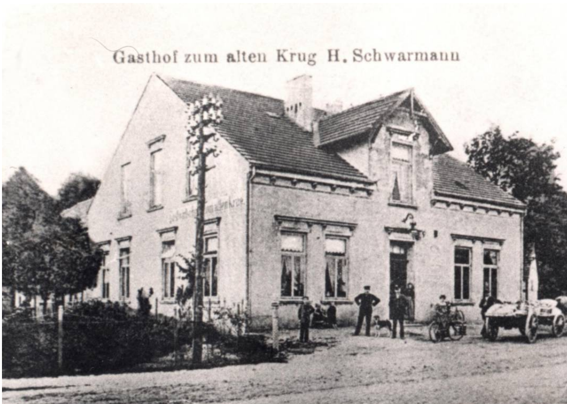
Gasthof zum alten Krug H. Schwarmann

1902 Das alte, schräg zur Straße stehende Gebäude wurde abgerissen und durch den Neubau, der noch heute besteht, ersetzt. Das Gebäude wurde im Laufe der folgenden Jahre - insbesondere in der Zeit Mathias Bitters - stetig weiter ausgebaut und modernisiert.