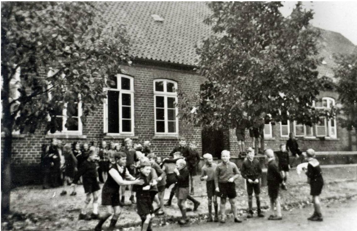
Bild 3 : Die dritte Schule an der Dorfstraße. Im OG lag die Lehrerwohnung.