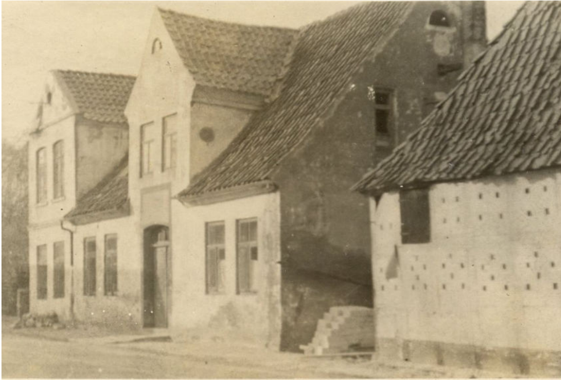
Haus Oyten 82 um 1900. Rechts im Bild ist die Scheune vom Hof Oyten 42 zu sehen.