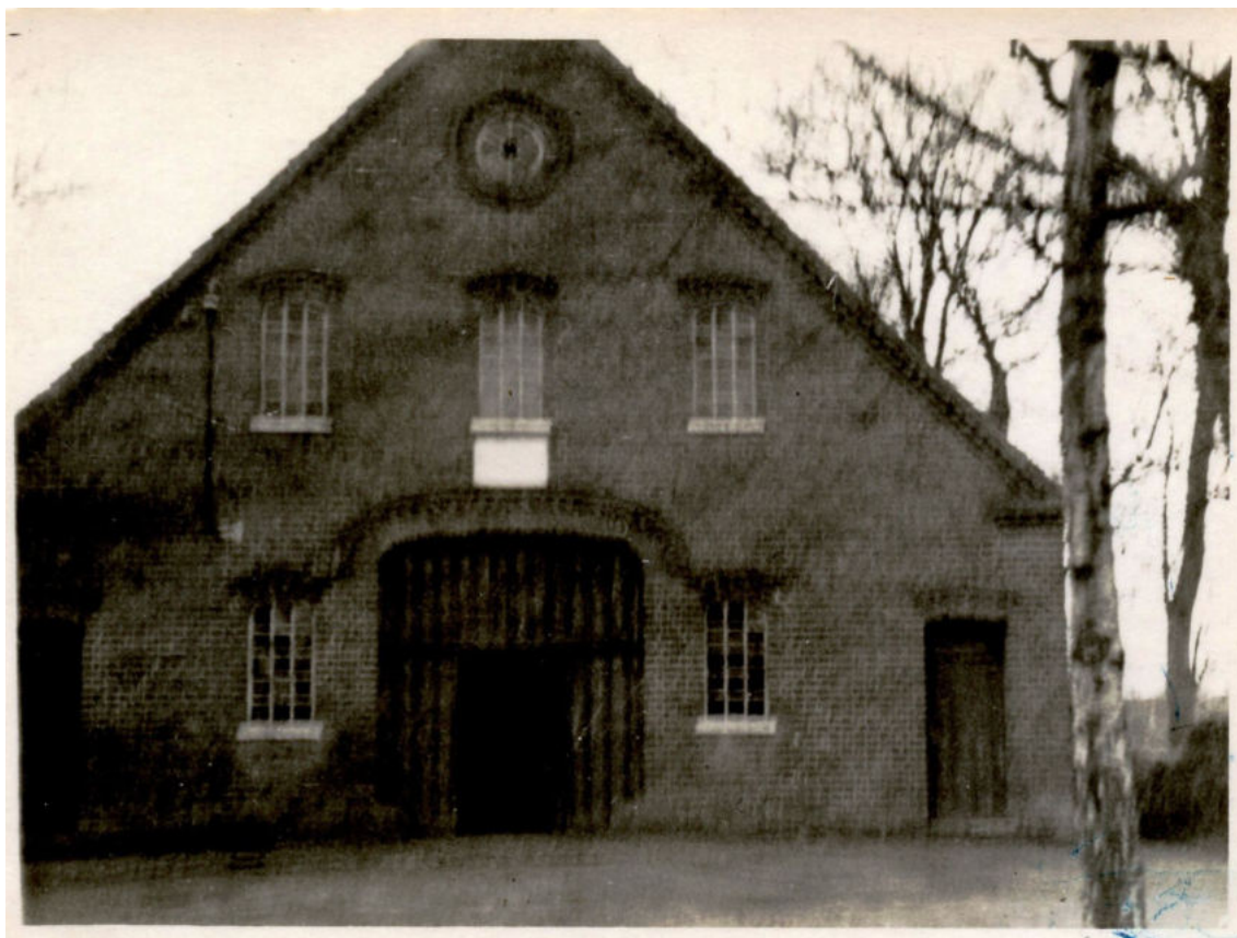
Anbauerstelle Oy 68