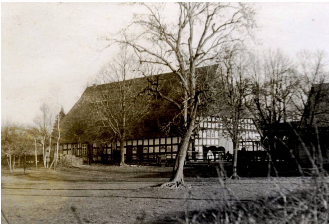
Ein wirklich imposanter alter Baumann-Hof um 1950.

Datum Personen / Ereignisse geboren/getauft verstorben/beerdigt