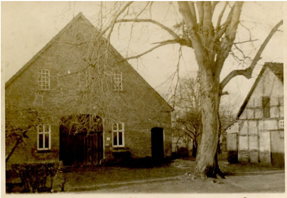
Um 1880 stand das alte mit Stroh gedeckte Bauernhaus noch mittig auf dem Hof am Brunnenweg an der Ecke Achimer Straße. 1899 brannte das Haus ab und Hinrich Bischoff ließ sich auf der Ostseite ein neues Haus bauen, direkt an der Achimer Straße gelegen, wie das Foto zeigt. An der Stelle steht heute das Haus Brunnenweg 36.