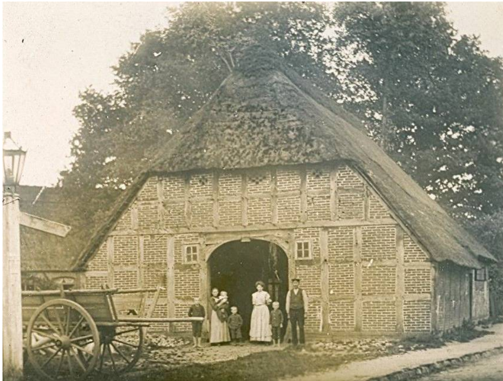
Die "Bärenschenke" um 1920.

Datum Personen / Ereignisse geboren/getauft verstorben/beerdigt