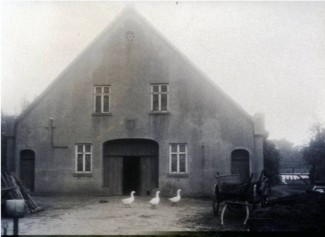
Das Foto zeigt das im Jahr 1864 neu errichtete Haus Oyten 16.

Datum Personen / Ereignisse geboren/getauft verstorben/beerdigt