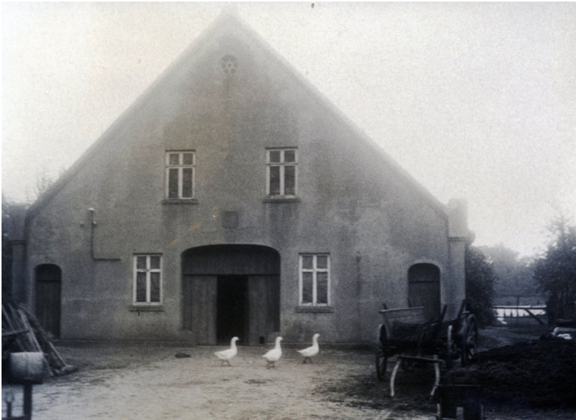
Das Bild zeigt das im Jahr 1864 errichtete Haupthaus der Baumannstelle Oyten 16.