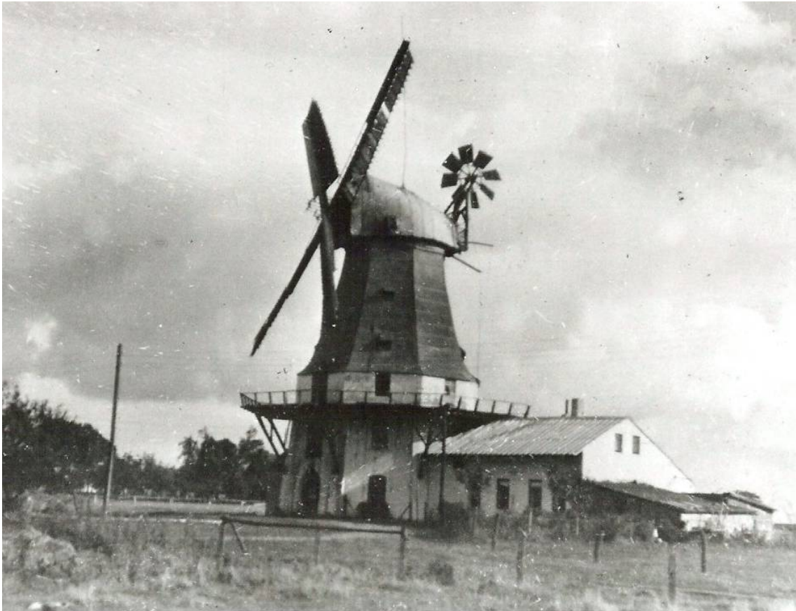
Zum Haupthaus der Baumannstelle liegt derzeit kein Foto vor. Dieses Bild zeigt die um 1856 erbaute Mühle um das Jahr 1900.

Zur Baumannstelle Oyten 6 gehörte als Nebenhaus Nr. 6f auch eine Windmühle. Sie stand nicht beim Haupthaus, sondern auf einer Anhöhe am Ende des Mühlenwegs, neben der "Bremen-Harburger Chaussee", heute etwa Mühlenweg 4. Nach der Aufgabe der Baumannstelle Oyten 6 wurde sie noch bis 1992 als selbständiger Hof weiter betrieben. Zum Haus Oyten 6 liegt kein Foto vor. Aber es gibt ein paar Fotos von der Mühle.