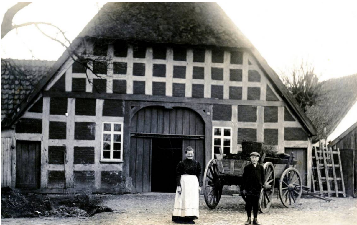
Johanne Hasch *Meenen um 1920 vor dem Haus Oyten 75

Datum Personen / Ereignisse geboren/getauft verstorben/beerdigt