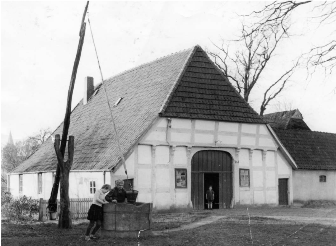
Das Bild zeigt das Haus Oyten 39 um 1930. Der Brunnen gehört zum Nachbarhaus, Dorfstraße 19. Das Haus wurde im Jahr 2022 abgebrochen und durch einen Neubau ersetzt.

Datum Personen / Ereignisse geboren/getauft verstorben/beerdigt