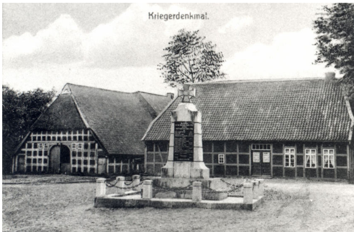
Das Foto zeigt links im Hintergrund den Baumann-Hof Oy 11 und rechts das Haus Oy 24. Haus 24 ist 1924 abgebrannt. 1925 wurde an der Stelle ein neues Wohnhaus errichtet. Das Nebenhaus 24a steht rechts vom Haus 24, gegenüber der alten Schule.

Datum Personen / Ereignisse geboren/getauft verstorben/beerdigt