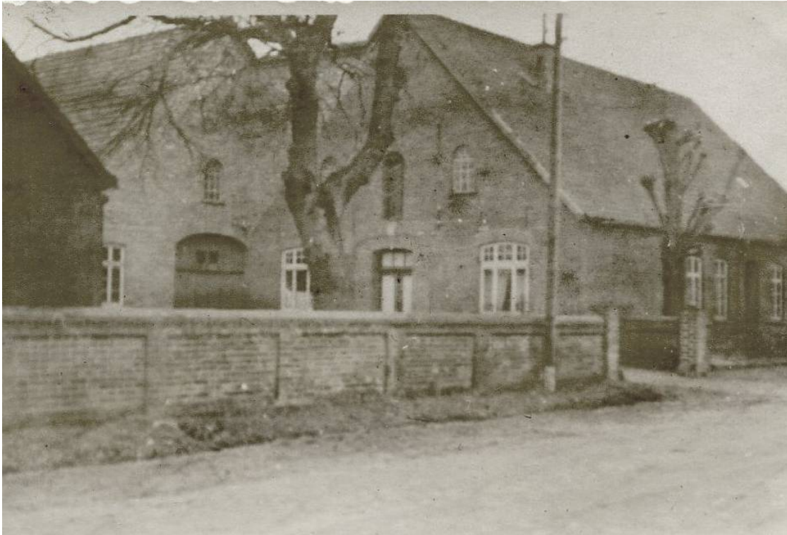
Hof Osmers, erbaut 1892