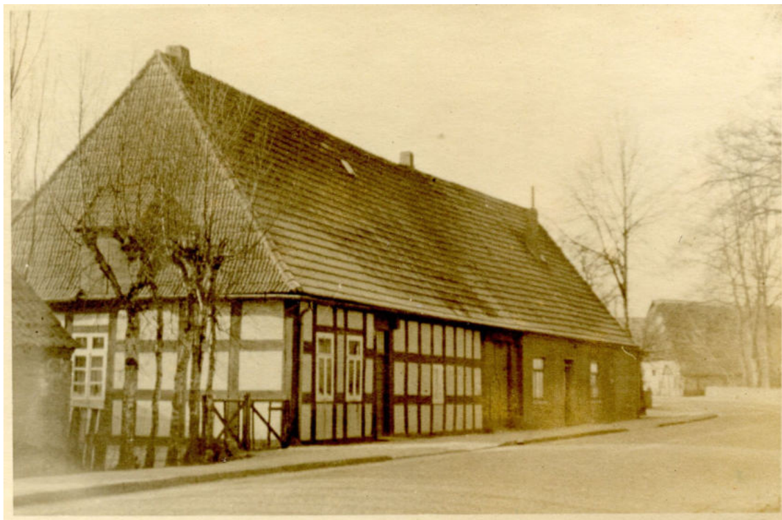
Die ehemalige Oytener Zehntscheune

Zum Hof Oyten 117 liegt kein eigenes Bild vor, es ist die vordere Hälfte des Hauses auf dem Foto (mit dem Fachwerk). Die hintere Hälfte gehört zum Haus Oyten 116, Lübke mann. Dieses Foto muss aus der Zeit nach 1880 stammen, denn in der Karte der Brandkasse von ~1880 sind die Häuser noch als mit Reet gedeckt gekennzeichnet. Weitere Informationen sh. unter Hof Oyten 16.