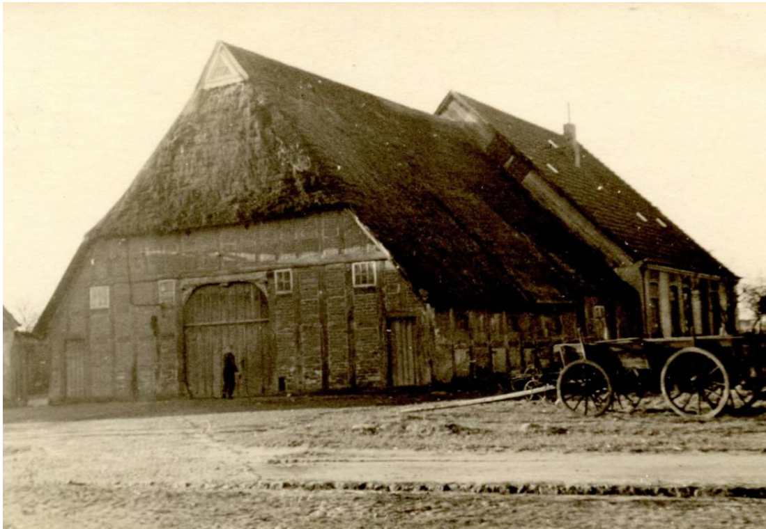
Das Foto (um 1950) zeigt das 1807 erbaute Haus. Der Hausname "Griesen Dierk" ist vmtl. zurückzuführen auf Diederich "Dierk" Lüllmann.

Datum Personen / Ereignisse geboren/getauft verstorben/beerdigt