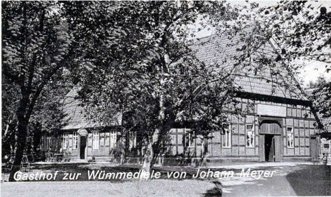
Der Gasthof "Zur Wümmediele" auf einer Postkarte von etwa 1950